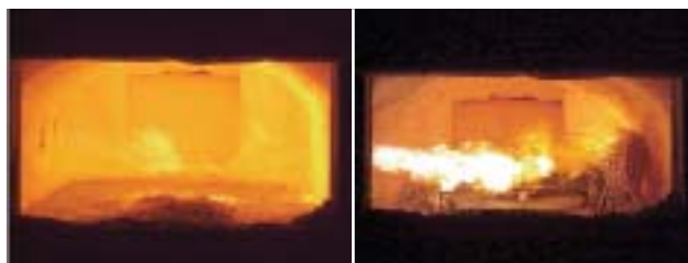
A. Udržiavanie teploty hliníka AIROX horák - 100% vzduch + plyn B. Tavenie hliníka AIROX horák - 100% kyslík + plyn

Pri udržiavaní teploty hliníkovej taveniny v peci napríklad počas legovania alebo pri iných prevádzkových prestojoch je oveľa výhodnejšie používať tzv. mäkký plameň tj. so vzduchom – obr. A . Pri tavení je výhodné zase použiť ostrý plameň so zvýšeným obsahom kyslíka až do obsahu 100 % – obr. B .