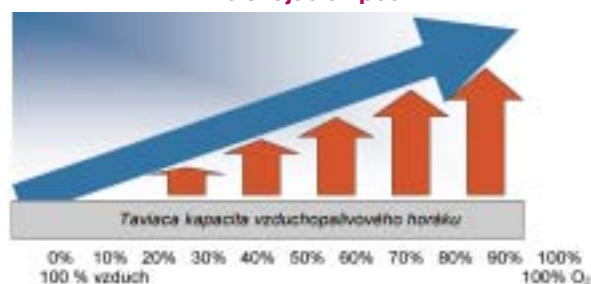
Prevádzka so vzduchovým horákom Prevádzka s kyslíkovým horákom

Z grafického znázornenia je zrejme, že taviaci výkon sa zvyšuje úmerne s koncentráciou kyslíka v horáku a môže dosiahnuť v závislosti od kvality vsádzkovaného materiálu až 130 – 160 % taviacej kapacity vzduchového horáka.